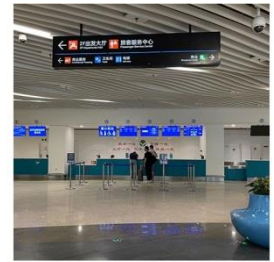
廈門五通碼頭船務櫃檯