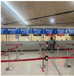
金門水頭碼頭船務櫃台